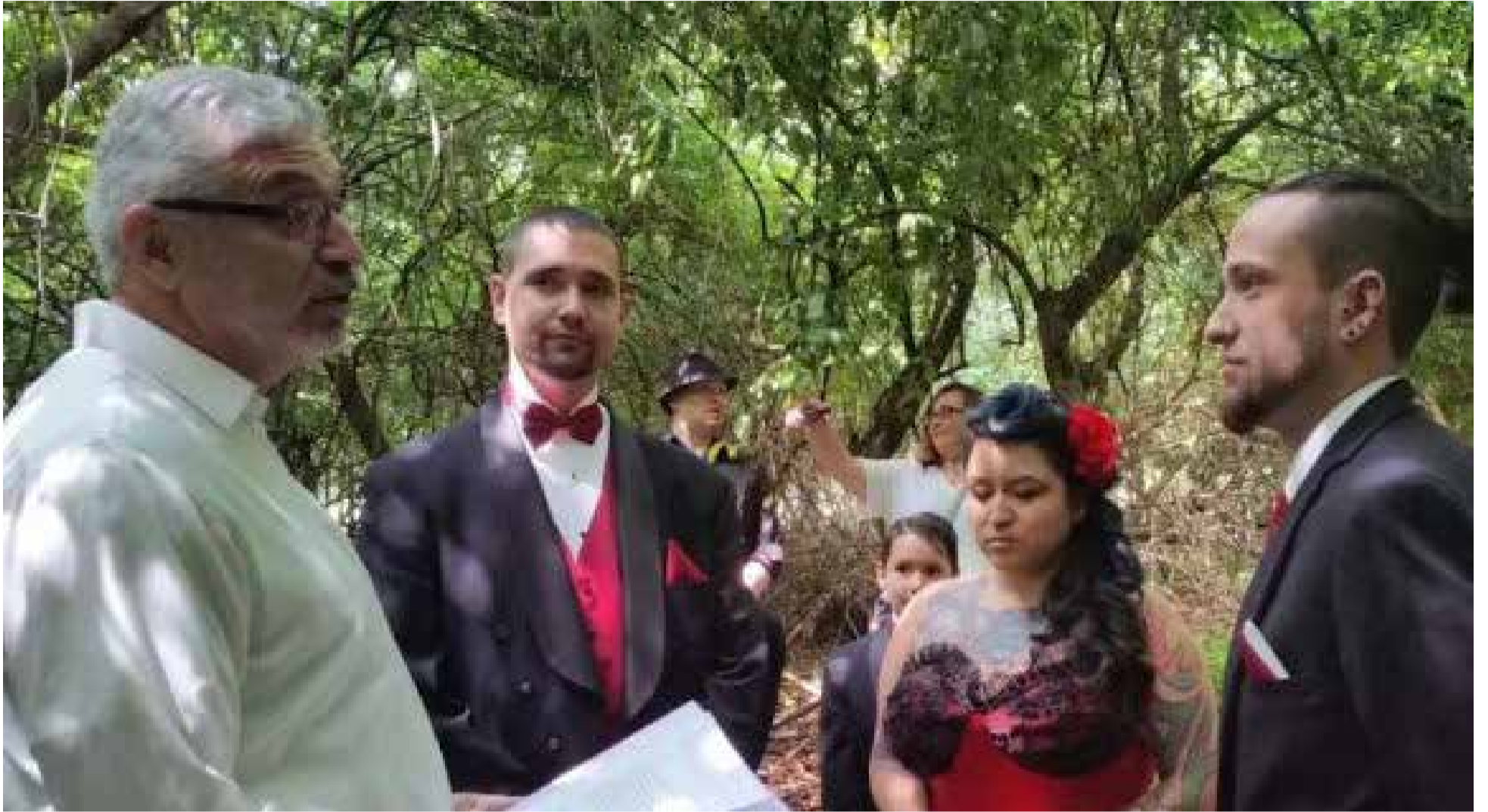
Esta mujer se casó con dos hombres. Cría junto a dos esposos a sus tres niños.

sibilidades de felicidad y satisfacción.