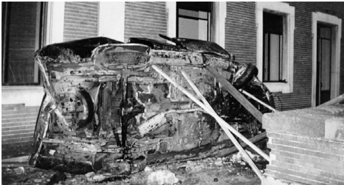
Atentado a Carrero Blanco

Unas horas más tarde, me detuve frente a una plazoleta circular, en el barrio de Salamanca. No tenía registro de que existiera tal zona, que notaba con otros aires, otras fragancias. Cruzé la plazoleta y entré a una calle que tenía por nombre: Claudio Coello. Noté que era un conjunto de cuadras donde había comercio, lindísimos edificios con balcones, hospitales, un asilo de huérfanos, el convento de Santo Domingo el Real, en fin. Era una vía pública distinta para