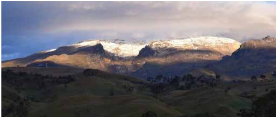
Vista panorámica del Volcán Nevado del Ruiz.