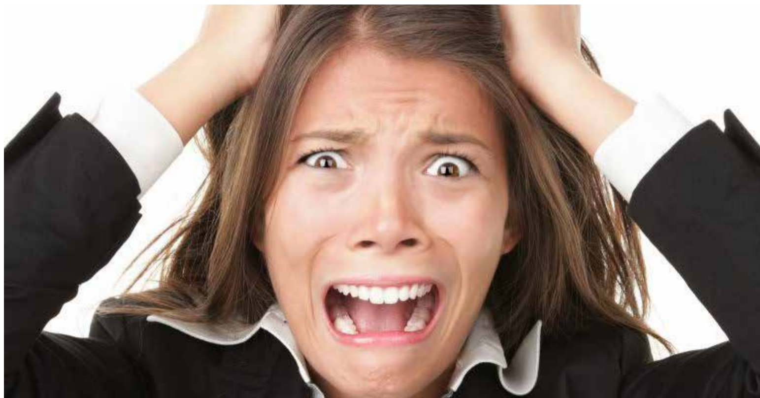
Las relaciones influyen directamente en la autoestima de las mujeres. Esto las hace sentirse insatisfechas con ellas mismas, poco valoradas y hasta feas.

Al mantener relaciones constantes con su compañero, los anticuerpos funcionan perfectamente. Pero cuando dejan de practicarlo con regularidad se afectan los anticuerpos antivirales en un 35%. Esto provoca que la mujer sea más propensa a enfermarse.