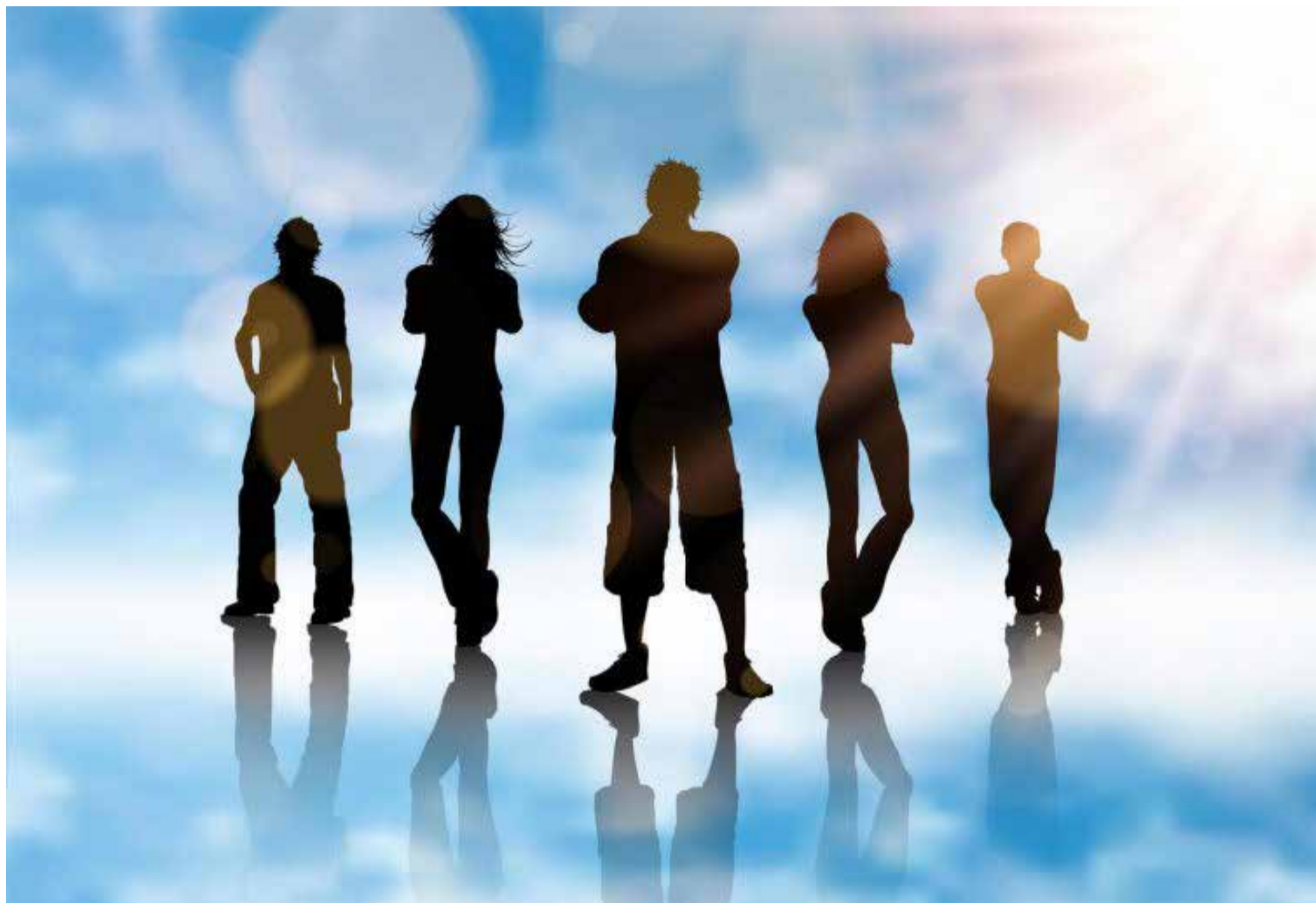
La nueva generación de los narcos: los invisibles.