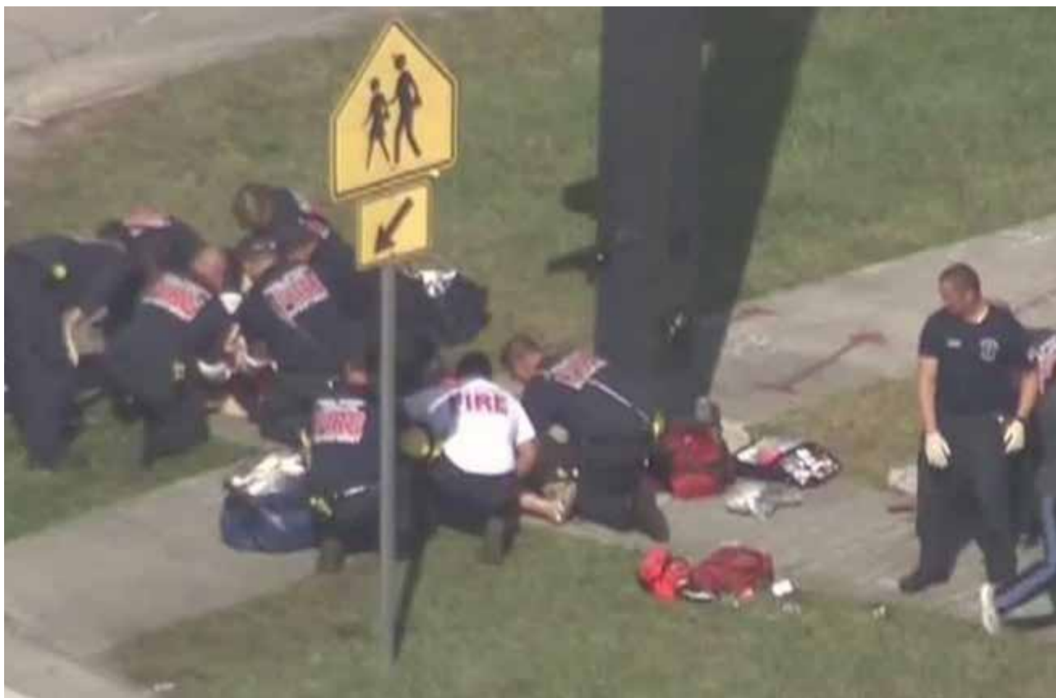
Los frecuentes tiroteos en Estado Unidos dejan sin vida a muchas personas.