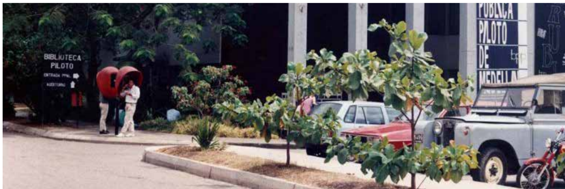
Biblioteca Pública Piloto de Medellín